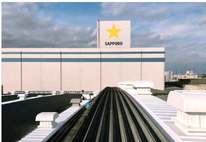
■ 1ダクト延長：幅 2.0m×長さ 83.0m